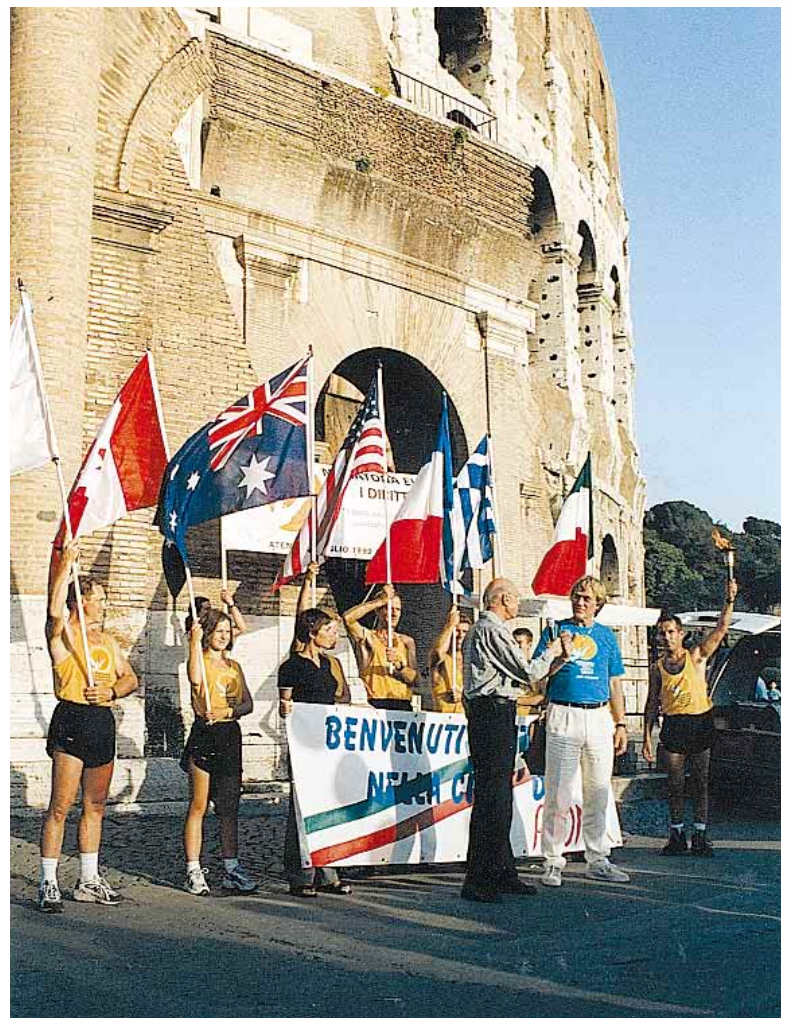
Der Europäische Marathon für Menschenrechte begann im Juli 1999 in Athen (ganz links). Die 4 500 Kilometer lange Reise führte durch sieben Länder, bevor sie in Hamburg endete. Entlang der Route unterzeichneten Regierungs- und Behördenvertreter, Repräsentanten verschiedener Religionsgemeinschaften und Tausende von Bürgern eine Proklamation für Menschenrechte (oben links).

Menschenrechte, der gleichermaßen von Christen, Juden, Moslems, Buddhisten und Vertretern zahlreicher Minderheitsreligionen unterstützt wurde.